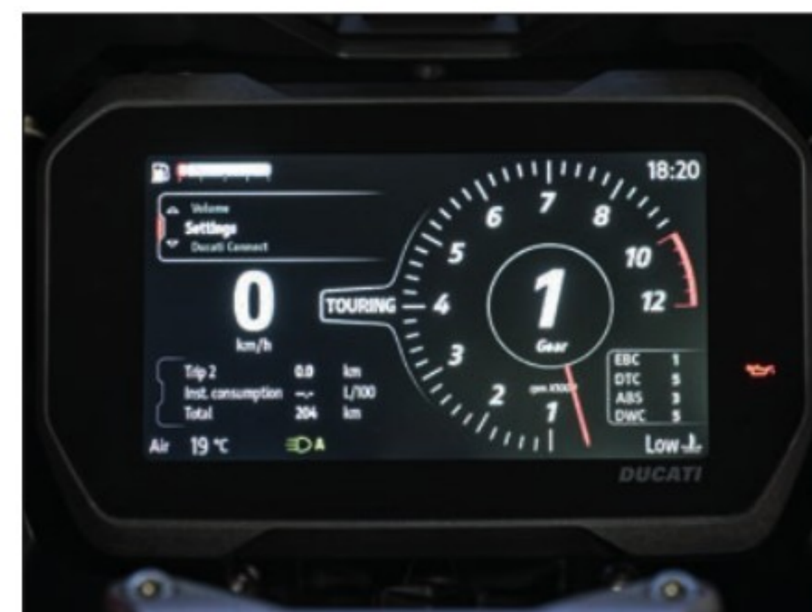
La dalle TFT de 6,5 pouces de diagonale est dotée d'un verre minéral résistant aux rayures. Non tactile, elle profite d'une ergonomie améliorée, commandée via un joystick sur le commodo gauche.

ASSURANCE (Mutuelle des Motards) Paris: 318/579 €* Nantes: 267/440 €*