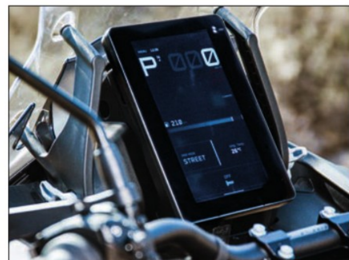
Le nouvel écran TFT vertical de 8 pouces est une "centrale" technologique : tactile, cette dalle extrêmement riche est dotée de menus ergonomiques plutôt intuitifs, en dépit de la somme d'informations disponibles.

MOTEUR bicylindre en V à 75° à refroidissement liquide, 4T, 2 ACT, 4 soupapes par cylindre CYLINDRÉE (al. x cse) 1350 cm 3 (110 x 71 mm) PUISSANCE 173 ch à 9 500 tr/min COUPLE 145 N.m à 8 000 tr/min BOÎTE DE VITESSES à 6 rapports TRANSMISSION FINALE par chaîne FREIN AV (étriers à x pist.) 2 disques, Ø 320 mm (4 opp.) FREIN AR (étrier à x pist.) 1 disque, Ø 267 mm (1) PNEUS AV - AR 120/70/19 - 170/60/17 RÉSERVOIR 23 litres POIDS 246 kg en ordre de marche ASSURANCE (Mutuelle des Motards) Paris: 285/683 €* Nantes: 246/493 €*