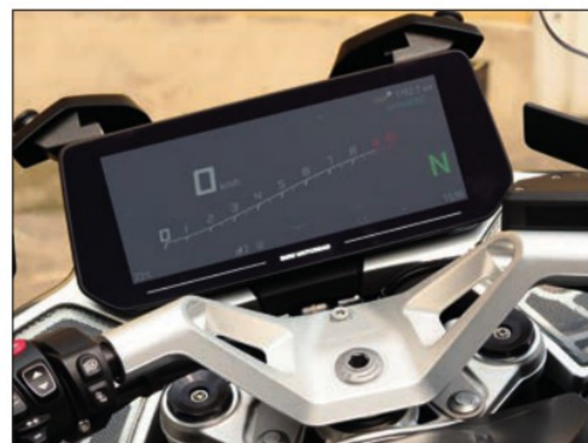
Toujours plus grand (10,25 pouces), toujours plus large ! Rien à dire sur le plan de la lisibilité, même si l'ergonomie de certaines commandes a gagné en complexité par rapport à la génération précédente.

MOTEUR bicylindre à plat à refroidissement par air et eau, 4T, 2 ACT, 4 soupapes par cylindre CYLINDRÉE (al. x cse) 1300 cm 3 (106,5 x 73 mm) PUISSANCE 145 ch à 7750 tr/min COUPLE 149 N.m à 6500 tr/min BOÎTE DE VITESSES à 6 rapports TRANSMISSION FINALE par cardan FREIN AV (étriers à x pist.) 2 disques, Ø 310 mm (4 opp.) FREIN AR (étrier à x pist.) 1 disque, Ø 285 mm (2 juxt.) PNEUS AV - AR 120/70/17 - 190/55/17 RÉSERVOIR 24 litres POIDS 281 kg en ordre de marche ASSURANCE (Mutuelle des Motards) Paris: 327/565 €* Nantes: 271/432 €*