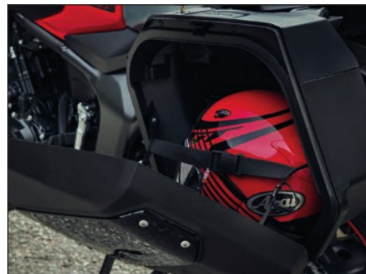
De série, les deux valises totalisent 65 litres de chargement : 28 litres à droite et 37 à gauche. Cette dernière peut ainsi loger un casque. Les sacoches internes souples sur mesure sont aussi fournies d'origine.