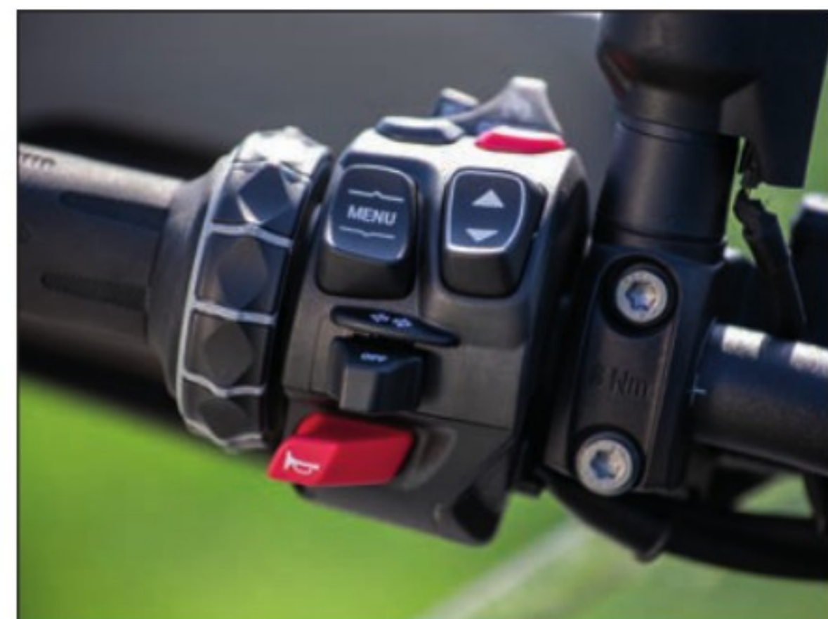
Molette, bouton "Menu", bouton "burger" de raccourcis (au-dessus) et flèches de réglage (bulle, poignées et siège chauffants, antipatinage, réglage des suspensions...): une simple opération peut se révéler complexe au début.