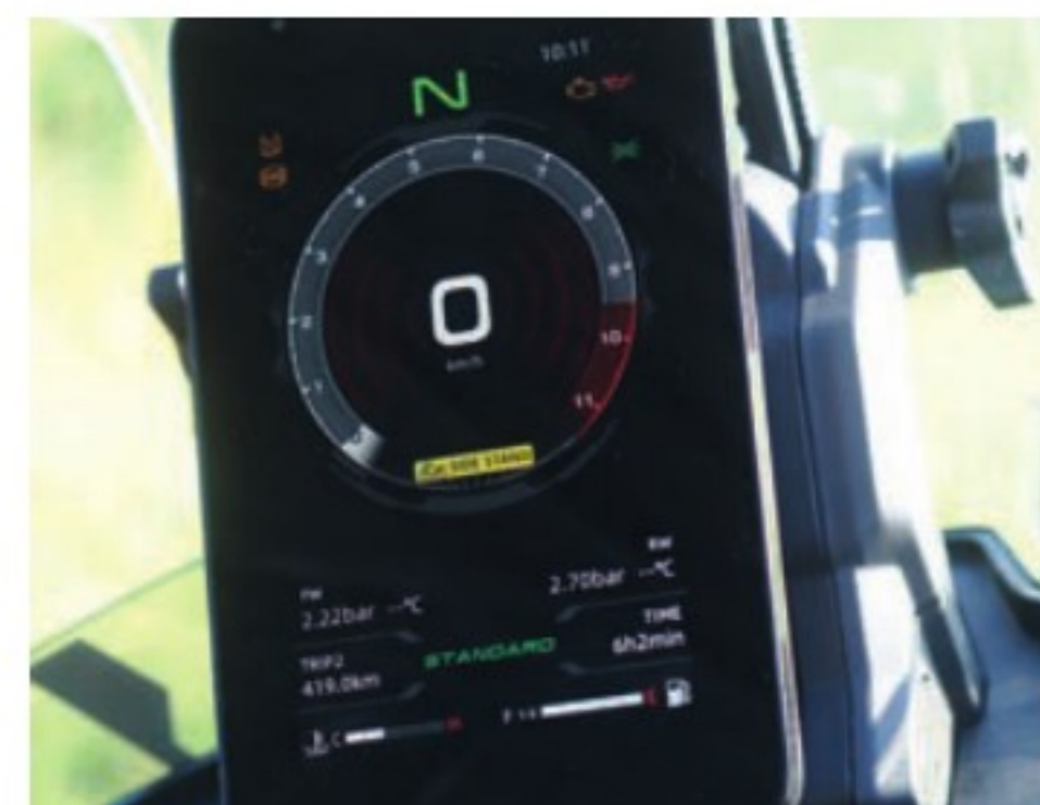
La dalle TFT verticale connectée de 7 pouces est moderne avec une ergonomie simple. S'il manque la température extérieure, celle des pneus est indiquée.

ASSURANCE (Mutuelle des Motards) Paris: 268/421€* Nantes: 233/348€*