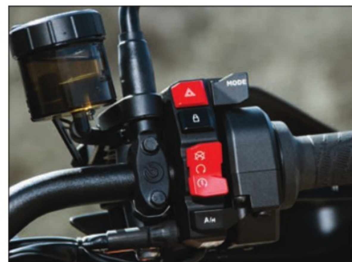
La transmission manuelle robotisée AMT permet au pilote d'opter pour un passage de vitesses manuel assisté, mode M (sans embrayage), ou pour une transmission entièrement automatisée en mode A.