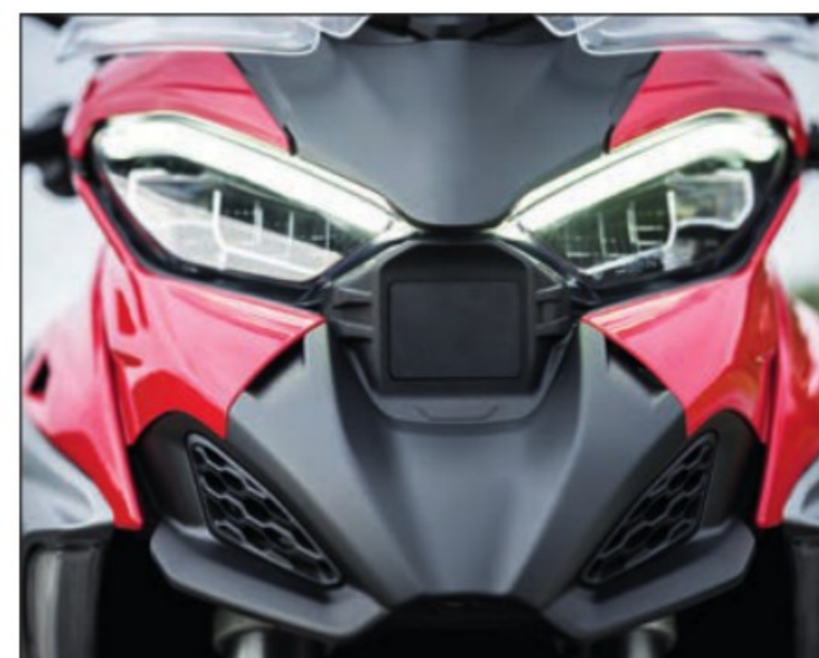
En dépit d'un très léger remodelage du "bec" avant, destiné à améliorer l'éclairage proche, la Multistrada V4 S 2025 peine à se singulariser de sa devancière.