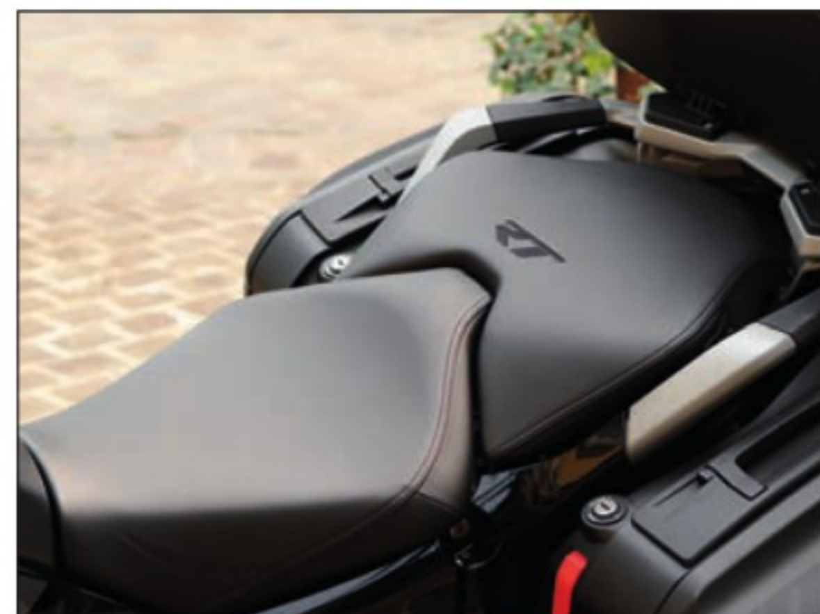
Le pilote et le passager sont particulièrement bien traités, avec les selles chauffantes, mais aussi le dossier ainsi que les poignées. La classe !