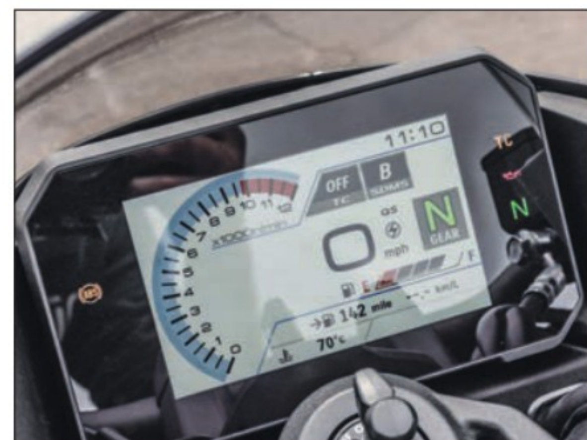
La dalle TFT de 5 pouces est simple et bien fichue. Toutes les infos importantes sont sous les yeux : vitesse, tours/minute, rapport engagé, horloge et jauge de carburant. C'est nickel!

“ PLUS QUE SON STYLE SYMPA, LA GSX-8TT EST UN VRAI BON ROADSTER ”