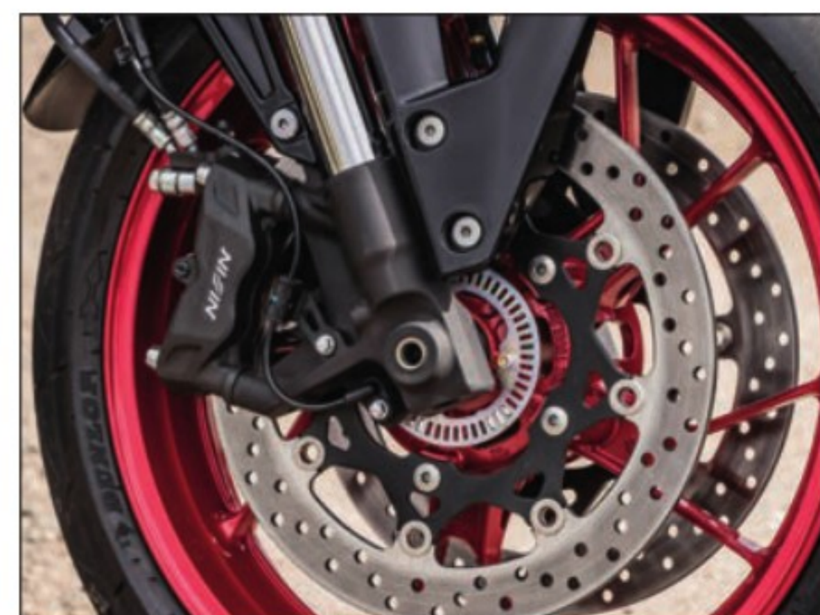
La progressivité du double disque de 310 mm pincé par des étriers Nissin fait merveille, et vous pouvez sans souci prolonger votre freinage de manière dégressive jusqu'au point de corde pour aider la moto à tourner.