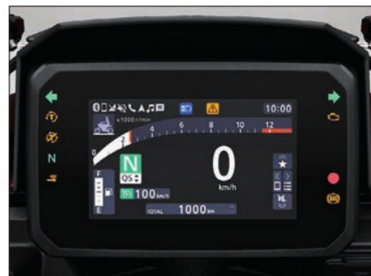
Cet écran de 5 pouces centralise l'ensemble des informations utiles, même si certaines manquent un peu de lisibilité. Trois modes d'affichage sont disponibles, avec la connexion Bluetooth via RoadSync pour la navigation.

ASSURANCE (Mutuelle des Motards) Paris: 318/459 €* Nantes: 267/375 €*