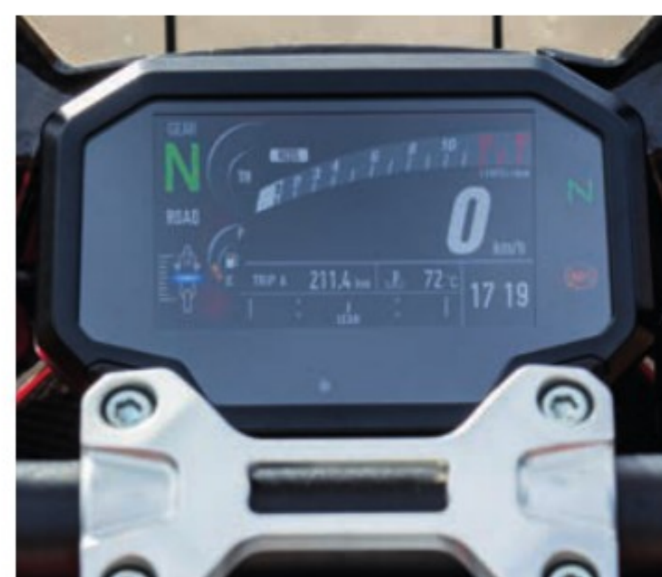
Le tableau de bord provient de la Kawasaki Z H2. C'est lisible et complet, rien à redire.

ASSURANCE (Mutuelle des Motards) "Prestige" Paris: 426/1211€* Nantes: 328/942€*