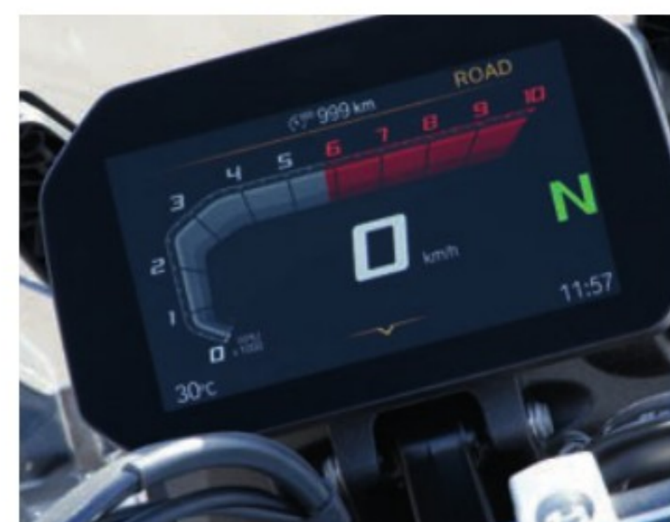
L'écran TFT de 6,5 pouces offre une lisibilité agréable, un affichage alternatif "Sport" et permet de visualiser les nombreuses pages annexes.

ASSURANCE (Mutuelle des Motards) Paris: 289/1030 €* Nantes: 248/681 €*