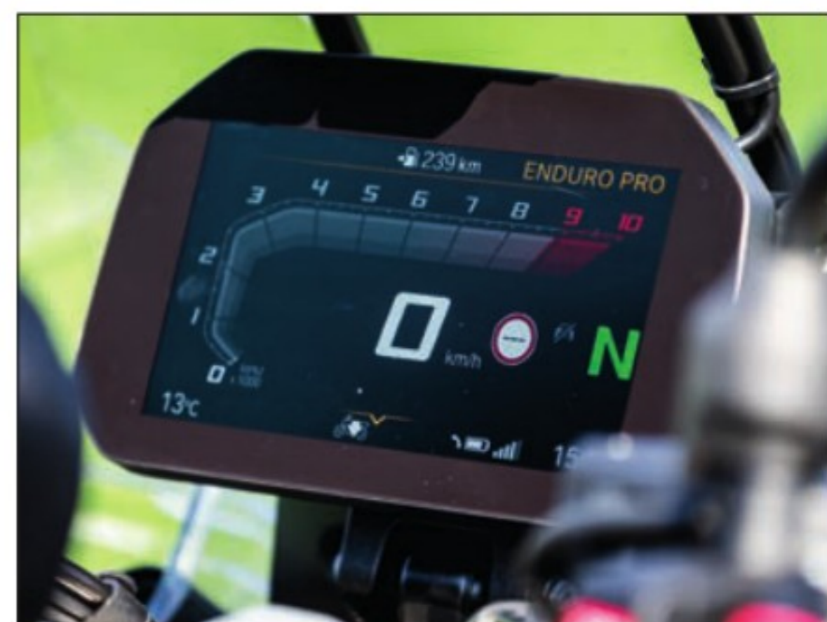
L'écran TFT de 6,5 pouces est agréable et lisible. Il est commun à de nombreux modèles de chez BMW. Très complet et gérant toute la moto, il demande un temps d'adaptation, mais la logique s'impose vite.

ASSURANCE (Mutuelle des Motards) Paris: 289/1030 €* Nantes: 248/681 €*